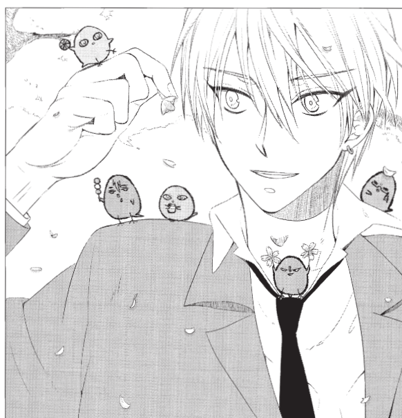
柄十はるか (ハリバリ)

その他Twitter (@kuroket0329) でも情報を展開しておりますのでフォローなどをしていただくと新しい情報を常に参照することができます。